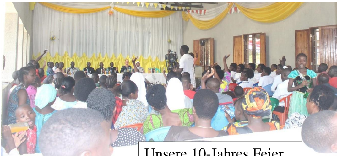
Unsere 10-Jahres Feier