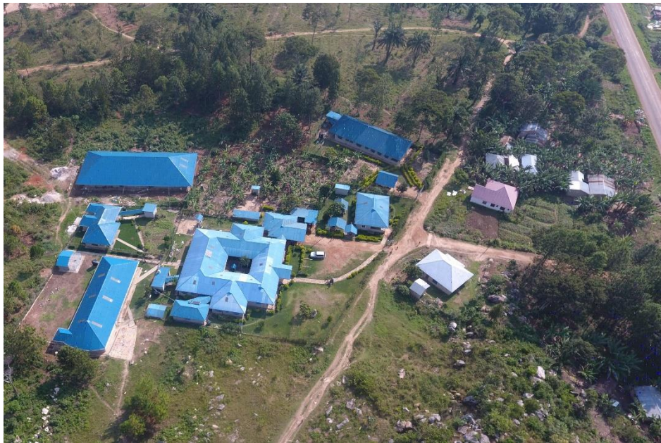
Blick auf das Nikolaushaus